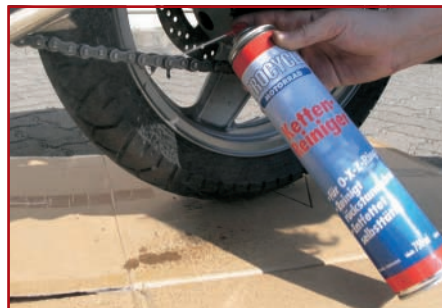
17. Ggf. Kette reinigen

Wir wünschen Ihnen allzeit gute Fahrt mit Ihrem betriebssicheren, gepflegten Motorrad.