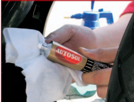
14. Verfärbungen auspolieren