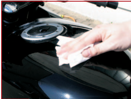
10. Gegen Polierkratzer gibt es Vliestücher

Auch auf Chrom und blankem Metall schadet ein Wachs-Pflegemittel nicht, vorausgesetzt die zu behandelnden Flächen werden nicht heiß. Es schützt vor Rost und lässt Wasser abperlen. Milchige Polituren vertragen sich häufig nicht mit rohen, leicht rauen Plastikteilen. Sie können in den Vertiefungen hässliche, weißliche Reste hinterlassen, die man später nicht mehr entfernen kann.