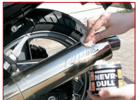
13. Chrom- & Aluteile blank machen