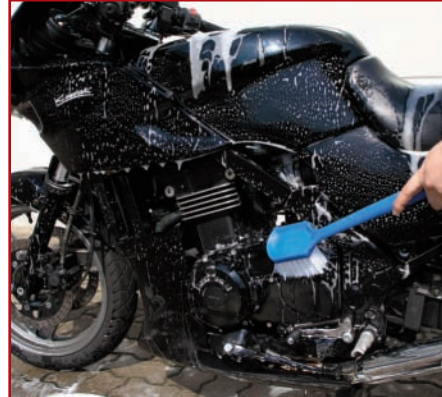
5. Insektenentferner, Blockbürste und Spezial-Bürsten