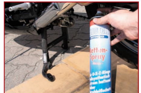
18. Kette fetten