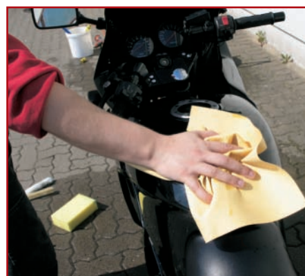
8. Gut abledern, um Wasserflecken zu vermeiden