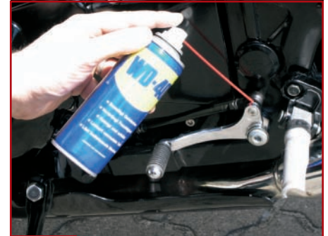
16. Gelenke & Hebel schmieren

schiebt die Maschine lieber noch einmal ins Sonnenlicht und schaut dort, ob er nicht etwas vergessen hat.