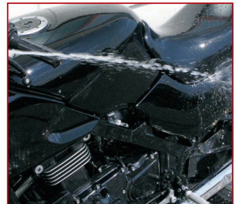
7. Mit klarem Wasser gut abspritzen

Sind Kratzer im Lack, empfehlen wir die Verwendung von spezieller Politur, z.B. S100 Lack- und Kunststoff-Polish (Best.Nr. 10004226). Diese ist mit feinen Schleifpartikeln versehen, damit sich die Kratzer auspolieren lassen. Bei kleineren Schrammen im Lack kann oft das Quixx Repair System (Best.Nr. 10004145) die letzte Rettung vorm teuren Besuch beim Lackierer sein.