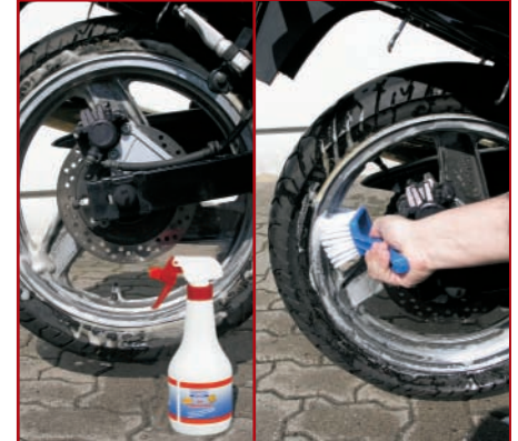
6. Ggf. Felgen schrubben

5. Hartnäckiger Insektenschmutz auf dem Scheinwerfer bzw. der Tourenscheibe lässt sich besser nach dem Einsatz des Procycle Insektenentferners (z.B. Best.Nr. 10004990) abwaschen. Schwer zugängliche Partien am Motor (Rippen), oder der Umlenkhebele der Hinterradfederung dürfen bei Bedarf mit einer Bürste (z.B. Best.Nr. 10004116) gereinigt werden. Für besonders stark verschmutzte „Rippen“ und schwer erreichbare Stellen bzw. Zwischenräume empfehlen wir das Procycle Pflegebürsten-Set (Best.Nr. 10004025). Verwenden Sie diese jedoch nicht für das Reinigen von Chromteilen und den empfindlichen Lack von Tank, Seitenteilen und Verkleidung! Den Schwamm und die Bürsten öfter im Eimer auswaschen, damit Sandpartikel keine Chance bekommen, die Oberflächen zu zerkratzen.