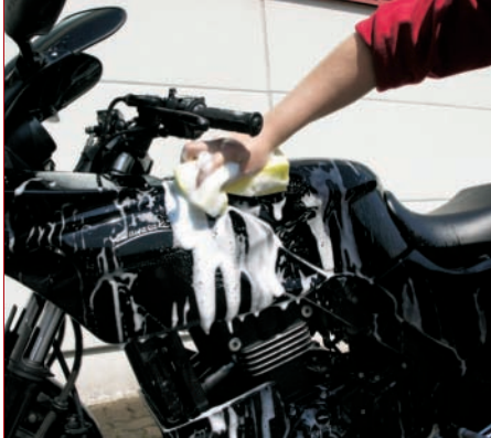
4. Schwammige Wäsche