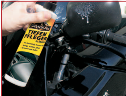
11. Kunststoffpflege mit Armor All – nicht für Fußrasten & Sitzbank

13.-14. Chromteile wie Endschalldämpfer, insbesondere verwitterte, pflegt man sehr effektiv mit NevruDull Polier-Watte (Best.Nr. 10004006) oder mit Chrom-Politur von Procycle (Best.Nr. 10004993). Hierbei nicht die Gabelstandrohre vergessen, denn festhaftender Dreck kann beim Einfedern die Gabeldichtringe beschädigen. Chromteile mit oberflächlichen Rostflecken oder auch verfärbtes VA wird hingegen mit Autosol Metal Polish (Best.Nr. 10004015) wieder blank. Rohes, poliertes Aluminium glänzt super nach einer Behandlung mit Alu-Magic (Best.Nr. 10004031), bei intensiver Anwendung sogar