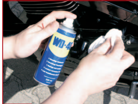
15. Vielzwecköl für Schraubenköpfe gegen „Alublüh“