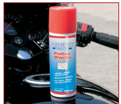
9. Polierwachs sorgt für echten Superglanz